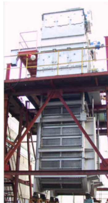
大容量ワイドフロースクリーン